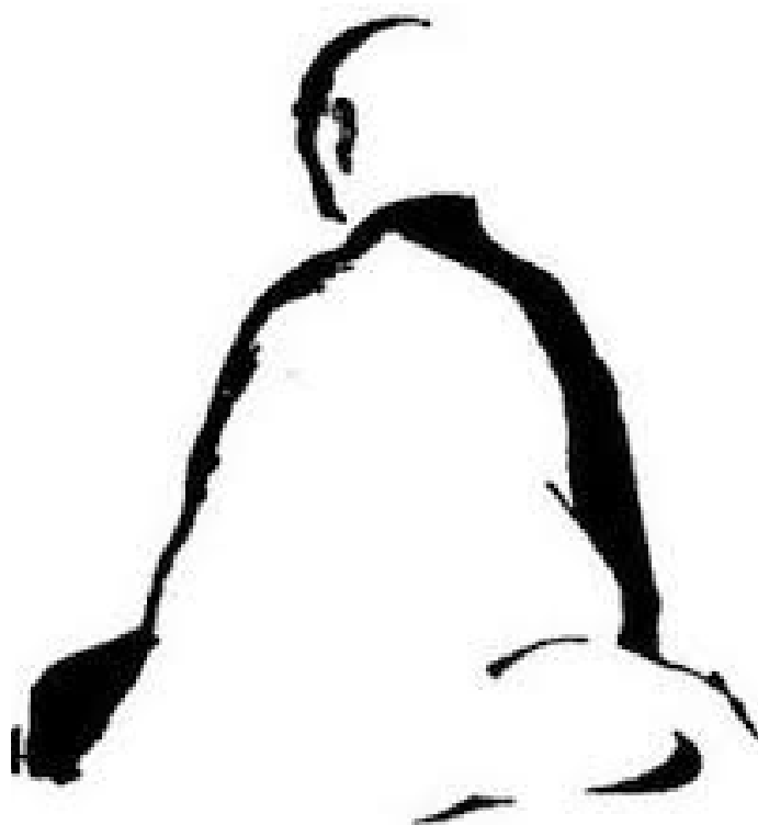
LE MAITRE ZEN, PERSONNAGE DE L'HISTOIRE

Les séances sont hebdomadaires ou mensuelles et peuvent se dérouler sur le temps scolaire ou en dehors selon les attentes et les besoins.